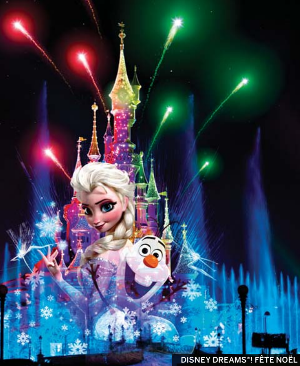
DISNEY DREAMS! FÊTE NOËL