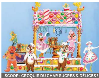
SCOOP : CROQUIS DU CHAR SUCRES & DÉLICIES !

F êter Noël en novembre ? C'est possible car toute la magie est déjà présente... et il y a généralement moins de monde qu'en décembre. Cette année, venez vivre avant les autres un Noël royal!