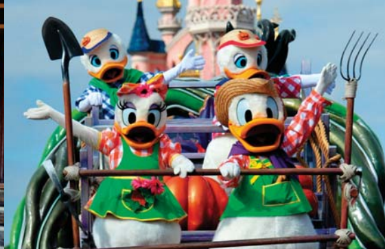
RETROUVEZ LES MÉCHANTS DANS LA COUR DU CHÂTEAU, LES DÉCORATIONS DANS FRONTIERLAND® ET LA FAMILLE DE DONALD DANS LA CALVALCADE D'HALLOWEEN.

H alloween, c'est le moment de l'année où les Méchants Disney sont de sortie. Sous l'influence "maléfique" d'une certaine sorcière, vous allez vivre un mois d'enfer!