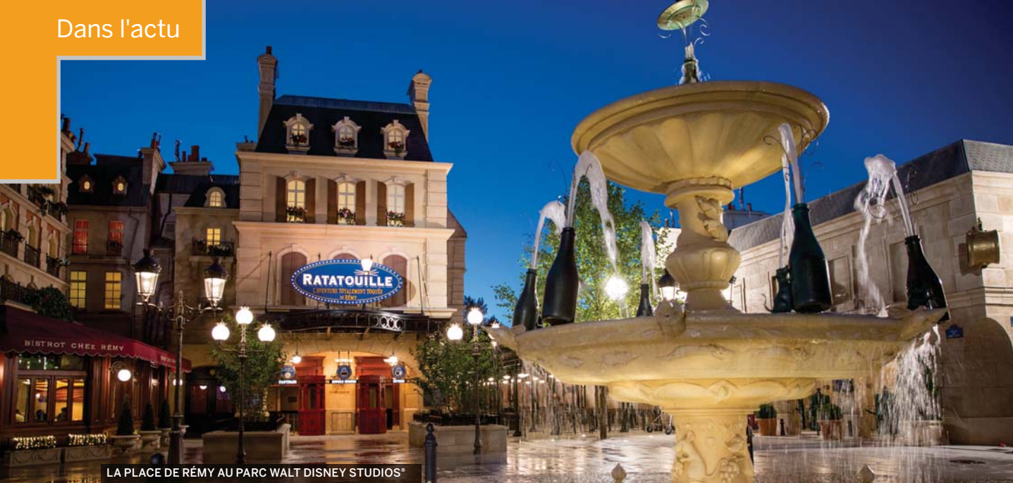
LA PLACE DE RÉMY AU PARC WALT DISNEY STUDIOS®