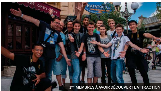
1 ERS MEMBRES À AVOIR DÉCOUVERT L'ATTRACTION