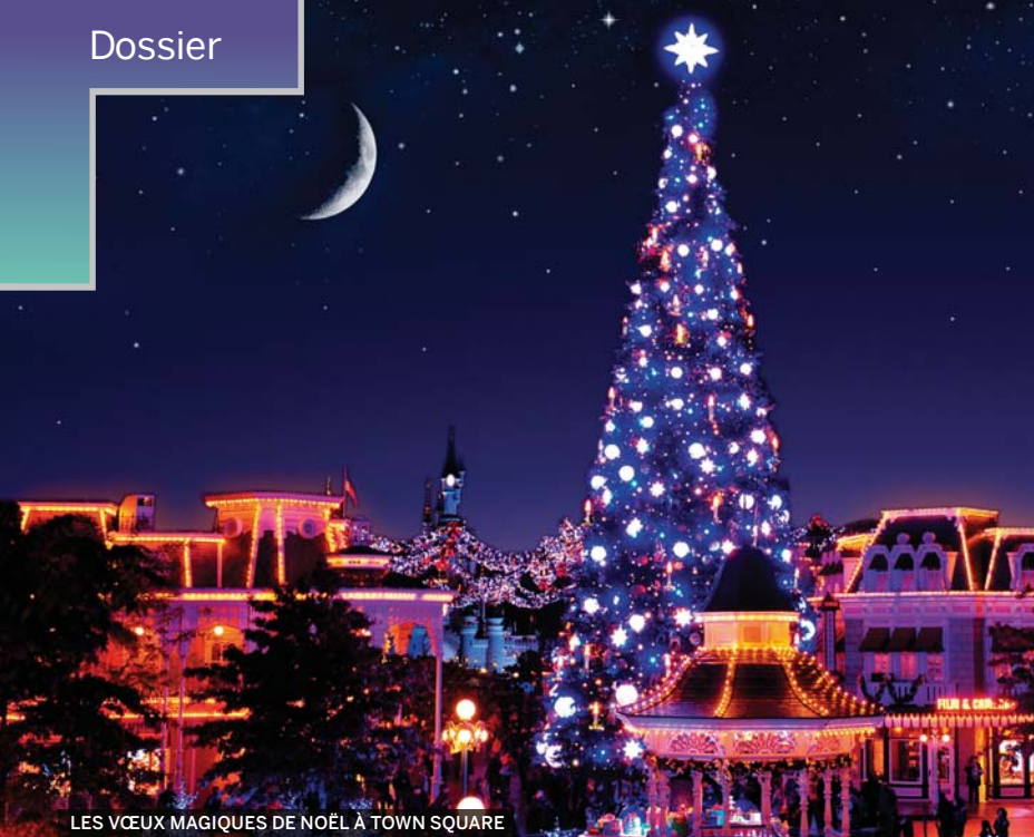
LES VŒUX MAGIQUES DE NOËL À TOWN SQUARE