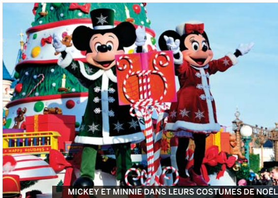
MICKEY ET MINNIE DANS LEURS COSTUMES DE NOËL