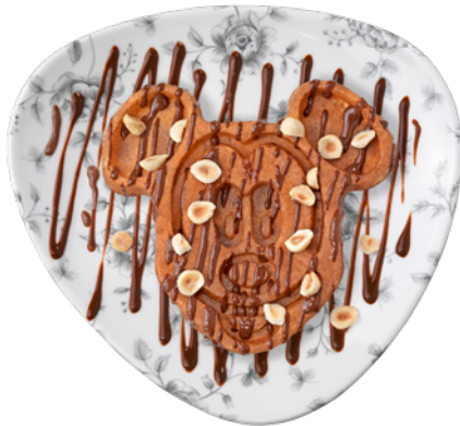
Gaufre au Nutella® et noisettes torréfiées Waffle with Nutella® and roasted hazelnuts 9 €