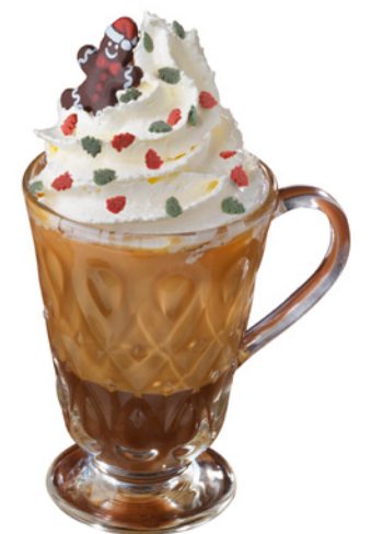
Café au lait sur un lit de crème de marron Coffee with milk on a layer of chestnut cream 5 €