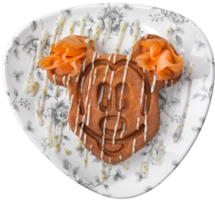
Gaufre au saumon et crème au raifort Waffle with salmon and horseradish cream 9 €