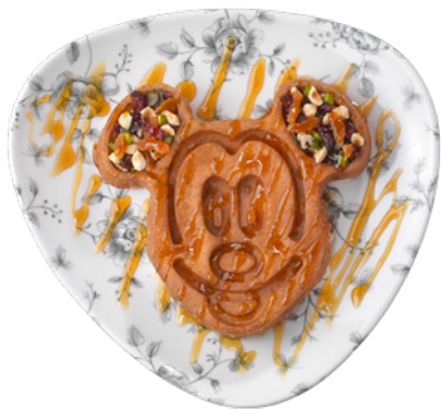
Gaufre granola et miel de Disneyland® Paris Waffle with granola and Disneyland® Paris' honey 9 €