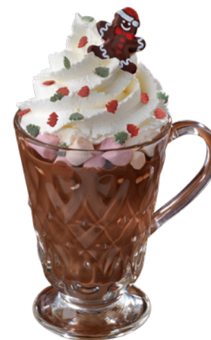
Boisson lactée cacotée avec marshmallows Hot chocolate with marshmallows 5 €