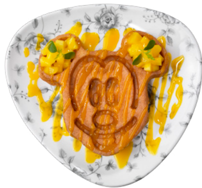
Gaufre à la mangue et coulis de fruits exotiques Waffle with mango and exotic fruit coulis 9 €

Supplément Crème Chantilly / Extra whipped cream 2 €