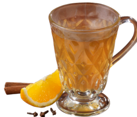
Vin chaud du jour (blanc ou rouge) White or red mulled wine of the day 6,50 €