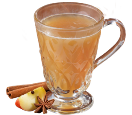
Jus de pomme chaud aux épices Hot spiced apple juice 5 €