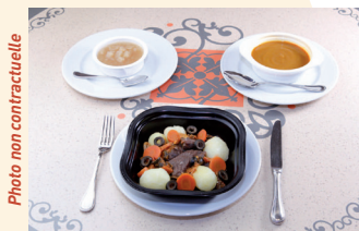
Exemple d'un repas pour allergique

Un choix de 2 entrées, 4 plats et 3 desserts, vous sont proposés dans les restaurants cités en page 5. La liste des ingrédients utilisés est exhaustive (il n'y a pas d'ingrédients cachés).