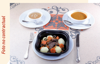
Ejemplo de una comida para persona alérgica

Proponemos 2 entrantes, 4 platos principales y 3 postres a elegir en los restaurantes indicados en la página 5. La lista de los ingredientes utilizados es exhaustiva (no hay ingredientes ocultos).