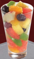
Coupe de salade de fruits Fruit Salad Cup