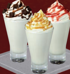
Sundae parfum vanille, accompagné de topping au choix : Sauce chocolat ou Sauce fruits rouges ou Sauce caramel au lait, pépites de noisettes caramélisées

Vanilla-flavoured sundae, with a choice of topping : Chocolate Sauce or Red Berry Sauce or Milk Caramel Sauce, crushed caramelised nuts