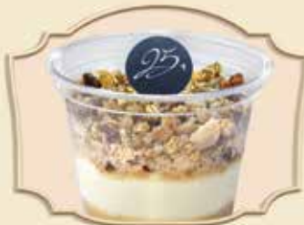
COUPELLE CRUMBLE POMME-CARAMEL ET CREAM CHEESE APPLE-CARAMEL CRUMBLE CUP AND CREAM CHEESE