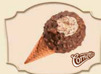
CORNETTO® CHOC'N'BALL CHOCOLAT AU LAIT/VANILLE/AMANDES MILK CHOCOLATE/VANILLA/ALMONDS