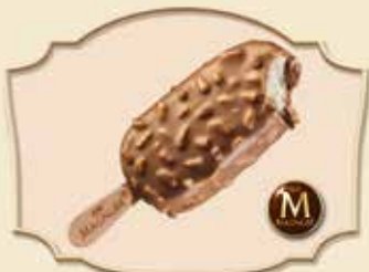
MAGNUM® AMANDE ALMOND