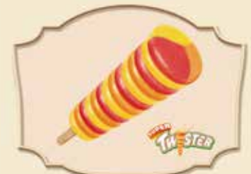
SUPER TWISTER® PARFUMS ORANGE/FRAISE/CITRON ORANGE/STRAWBERRY/LEMON FLAVOURS