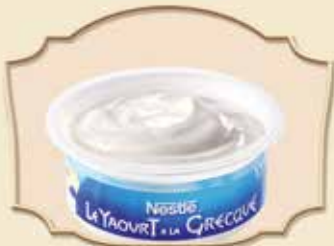
NESTLÉ® LE YAOURT À LA GRECQUE GREEK-STYLE YOGHURT