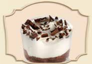
VERRINE FORÊT NOIRE BLACK FOREST VERRINE