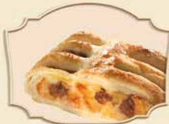
STRUDEL AUX POMMES APPLE STRUDEL