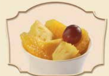
COUPELLE DE FRUITS FRAIS (SANS SUCRE AJOUTÉ) FRESH FRUIT CUP (NO ADDED SUGAR)