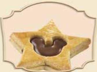
COOKIE ÉTOILE FOURRÉ CHOCOLAT/NOISETTE CHOCOLATE/HAZELNUT COOKIE