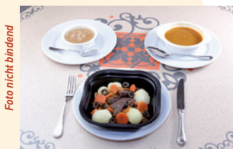
Beispiel eines Menüs für Allergiker

2 Vorspeisen, 4 Hauptgerichte und 3 Desserts stehen Ihnen in den auf Seite 5 genannten Restaurants zur Auswahl. Die Zutatenliste ist vollständig (es gibt keine Spuren von anderen Zutaten).