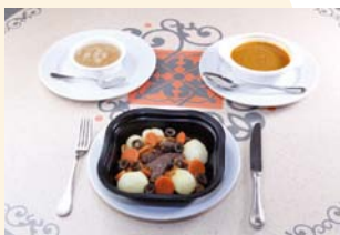
Exemple d'un repas pour allergique